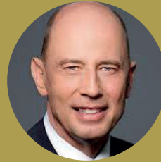
Minister Wolfgang Tiefensee

Soziologisches Forschungsinstitut Göttingen und Mitglied der Experten- kommission der Hans-Böckler- Stiftung zur „Arbeit der Zukunft“