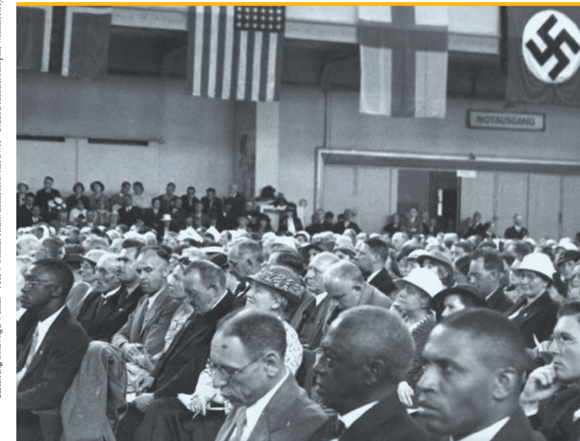
Gestaltung Goldwiese, Weimar Druck: Drucker Schapfel, Weimar; Recycling-Papier mit Bio-Druckfarben